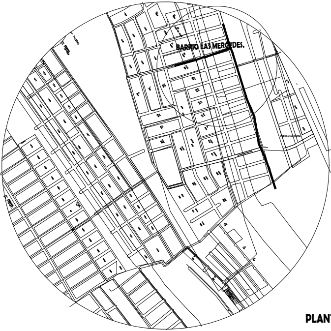
PLANTA DE LA CALLE.